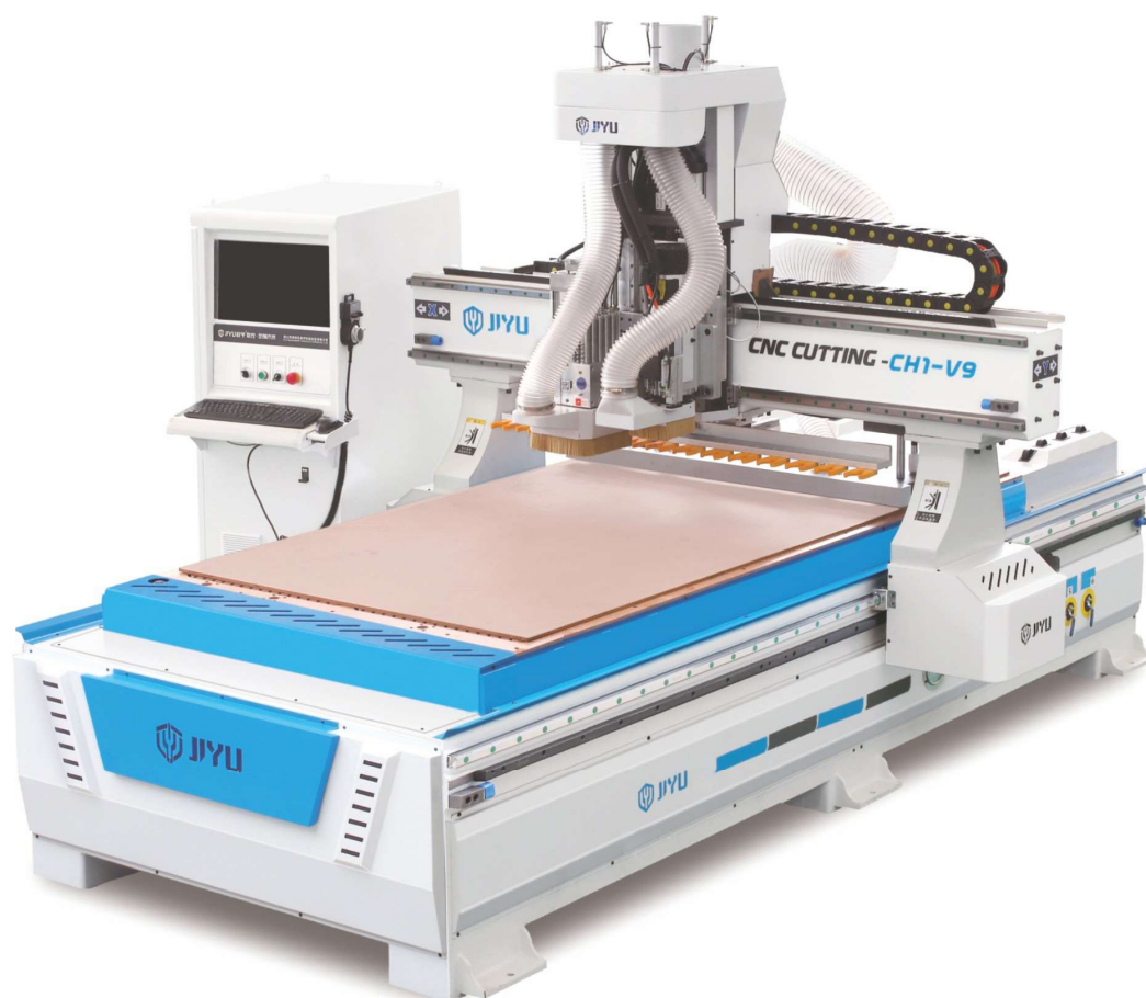
Фрезерный станок с ЧПУ СН1-12 / СН1-V9